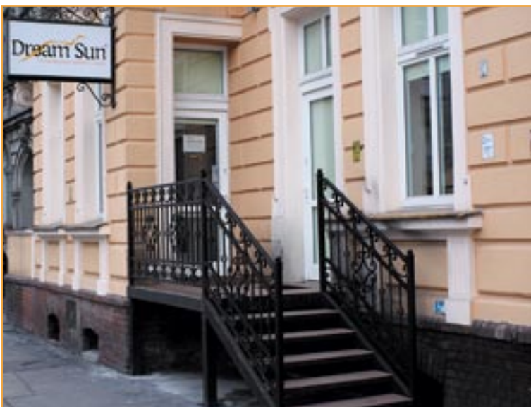
Salon Dream Sun, ul. Złotoryjska 108/1a

Salon Dream Sun posiada kompleksową ofertę zabiegów oraz produktów służących do modelowania wyglądu. Świadczy również profesjonalne doradztwo w zakresie indywidualnego doboru programu ćwiczeń w celu uzyskania w stosunkowo krótkim czasie upragnioną sylwetkę